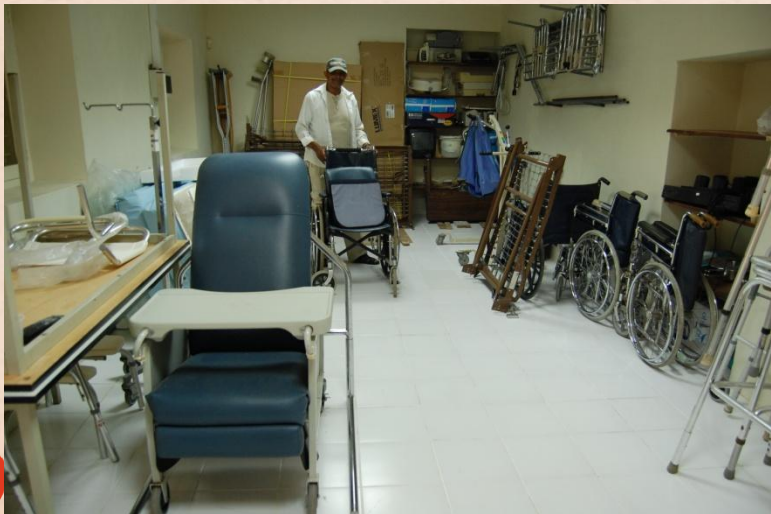
Hulpmiddelen zoals bedden en rolstoelen