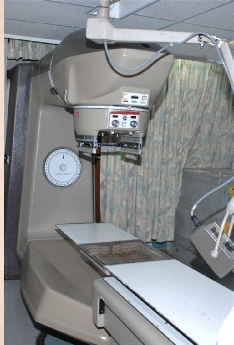
Cobalt Bron tbv de afdeling Radiotherapie van het St. Elizabeth Hospitaal