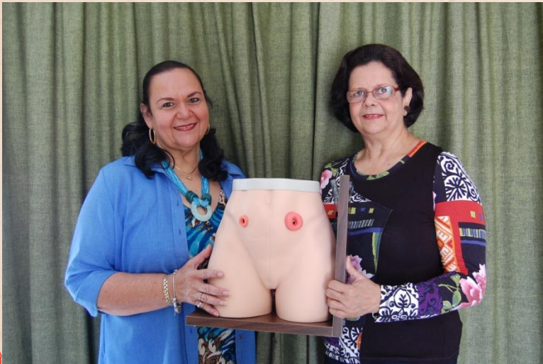
Donatie van een Stoma Dummie aan de Stomapatiëntenvereniging