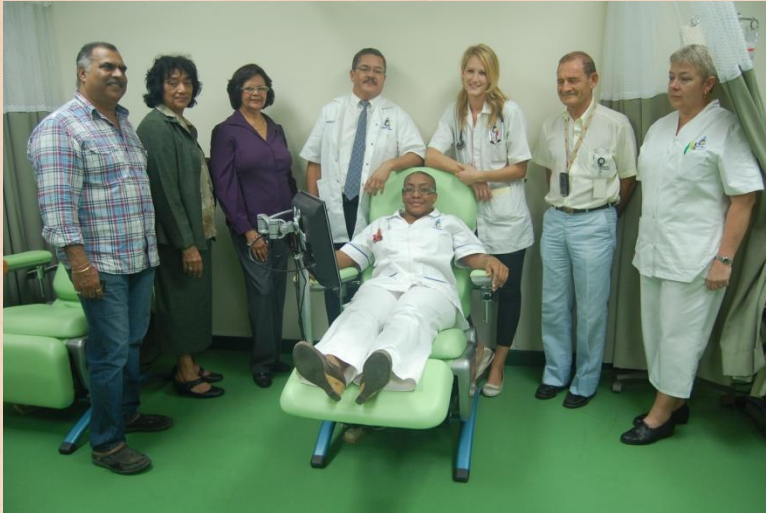
Ligstoelen tbv de Oncopolie Afdeling