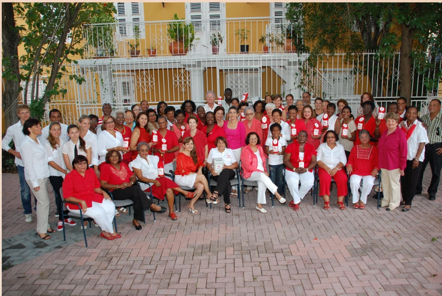
Het Bestuur, Personeel en Vrijwilligers van de Stichting Prinses Wilhelmina Fonds