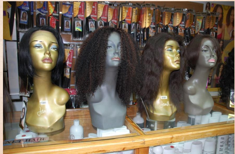
Groot assortiment van pruiken